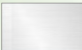
ステンレス(ヘアライン)