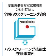
ホームページ用 バナー サンプル

ご希望の方は、裏面くお申込みのご案内>をお読みの上、 申込書および承諾書 の必要事項をご記入いただき、当協会事務局まで FAX または E-mail にてお申し込みください。